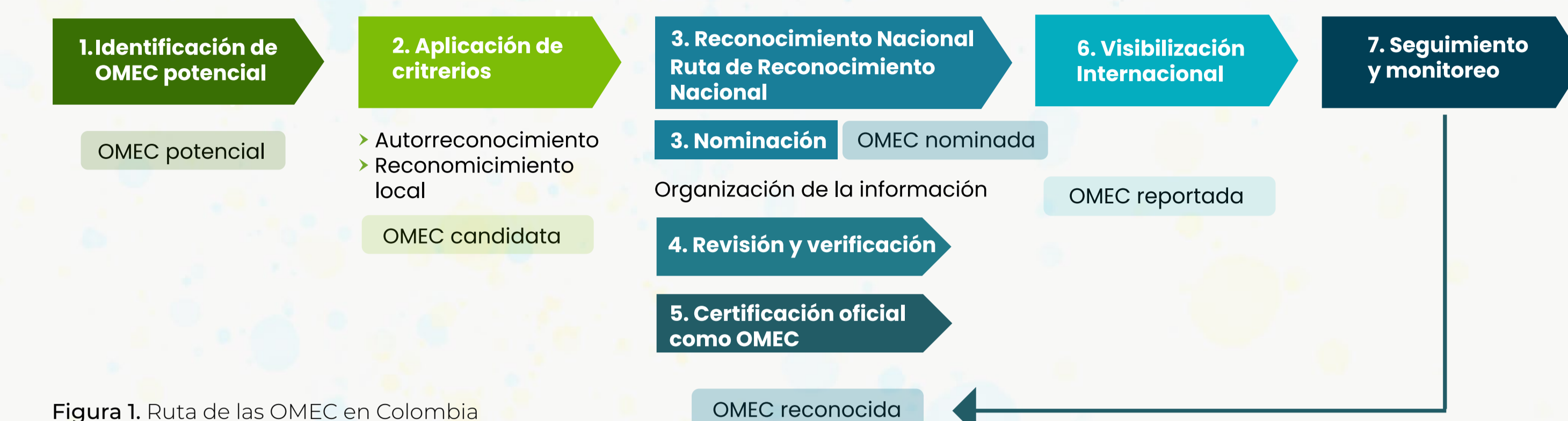
Figura 1. Ruta de las OMEC en Colombia

1. Identificación de iniciativas en marcha que pueden tener resultados positivos en conservación de biodiversidad y que es posible que cumplan con los criterios para ser una OMEC. En el documento Más allá de las áreas protegidas: avances en el fortalecimiento de las OMEC en Colombia 2024-2025 (Chaves et al., 2025a) se incluye un listado de figuras de manejo de paisaje donde podría haber OMEC potenciales.